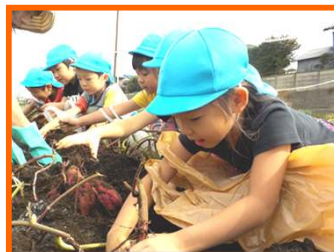
ぞう組 ここにあるかなあ～？