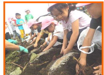
ひつじ組 出てきたでできた！