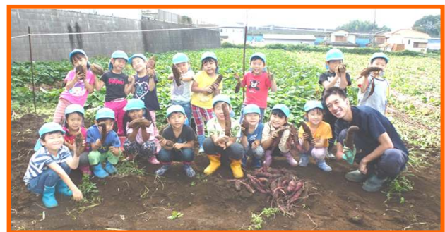
ぞう組 みんなでお芋を掘りました！

後日、園で行ったさつま汁パーティーに、今回のお芋を使用したので子ども達は鼻高々でした。