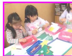
ひつじ組(4才)は ツリーの飾り付けを はさみで作りました。