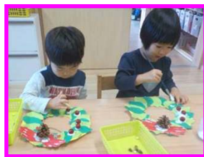
ぞう組(5才)は 折り紙で作ったリースの真中に サンタのステンドグラスを飾りました。