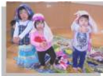
♪な～ぜこわがるか～ かわいらしい天使たち・・・

又一足早くぞう組さんが、手作りのクリスマスケーキをおやつに作ってくれ、皆にふるまってくれました。ぞう組さんありがとう♡