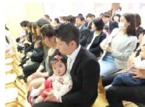
今日からひよこ組です♪