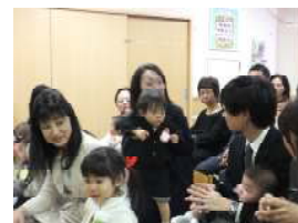
うさぎ組さん りすくみさん よろしくね！