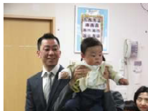
はじめまして！よろしくね