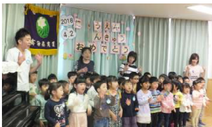
ようこそ たかさご保育園へ♪ ぞう組、ひつじ組に進級しました！