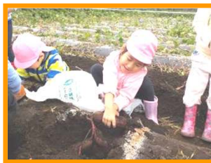
ひつじ組 出てきたでできた！