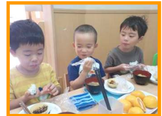
りす組 おにぎりおいしいね！ ぞうさんのさつまじるも おいしいね！