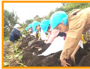
ぞう組 うんとこしょ どっこいしょ！