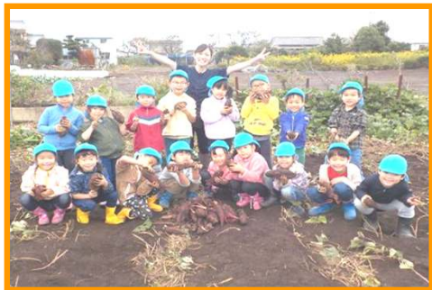
ぞう組 みんなでお芋を掘りました！