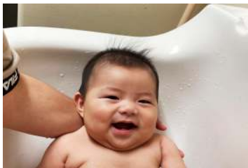
ひよこ1組 あ～気持ちいい