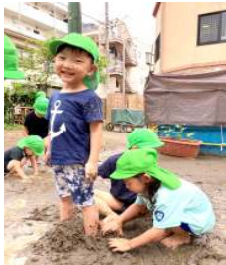
りす組 うわあ～うめられちゃった！

栽培を通して、子どもたちの目で見たこと、触り心地、匂い、感じた気持ちを大切に、心もからだも野菜のようにグングン育ってほしいと願います。