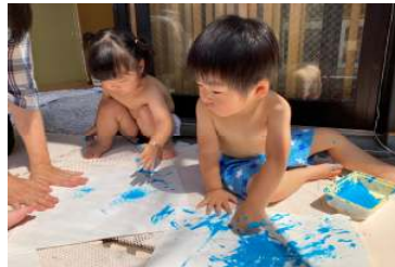
ばんび組 ペタペタって楽しいよ～