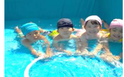
ひつじ組 フラフープにつかまってスーイスイ！