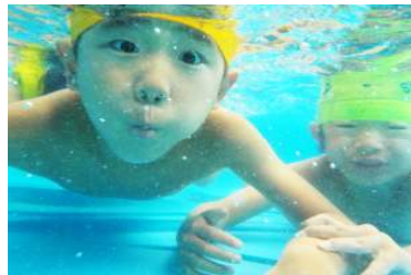
ぞう組 水の中は綺麗だよ～