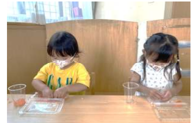
うさぎ組 冷たくて柔らかいよ～