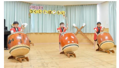
和太鼓の音を響かせました！ ぞう組(5才児)