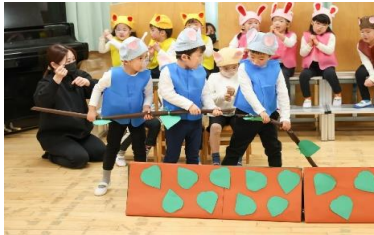
うんとこしょ～どっこいしょ！ りす組(3才児)