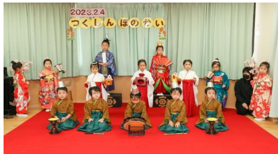
あかりをつけましょぼんぼりに～ ぞう組(5才児)