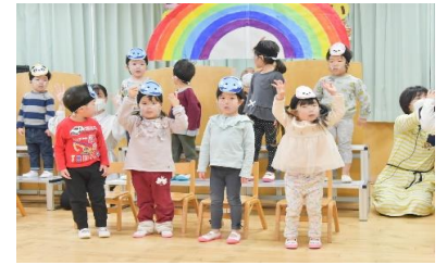
おそらにうかんだ虹の橋～♡ うさぎ組(2才児)