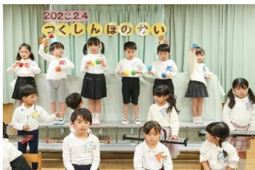
♪～つばめ音楽隊～♪ ひつじ組(4才児)